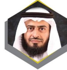
الأستاذ محمد بن مهدي الحارثي مدير عام التعليم بمكة المكرمة