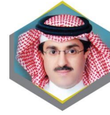
معالي الدكتور خالد بن عبدالله بن إبراهيم السبتي رئيس هيئة تقويم التعليم