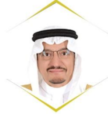
معالي الدكتور حمد بن محمد آل الشيخ وزير التعليم رئيس مجلس أمناء المؤسسة

تدار مؤسسة تكافل الخيرية من قبل مجلس أمناء، برئاسة معالي وزير التعليم بصفته الوظيفية وعضوية نخبة من أصحاب الفضيلة والمعالي والقياديين من رجال الأعمال والمتخصصين والتربويين.