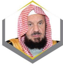
معالي الشيخ عبدالله بن سليمان بن محمد المنيع عضو هيئة كبار العلماء