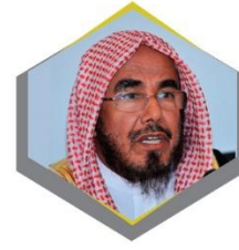
معالي الشيخ عبدالله بن محمد بن عبدالرحمن المطلق عضو هيئة كبار العلماء والمستشار بالديوان الملكي