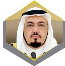
معالي الدكتور محمد بن أمين بن محمد الجفري نائب رئيس مجلس الشورى